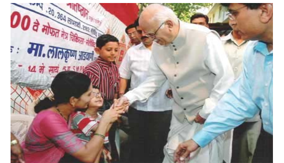
मोतीबिंदू मुक्त मुंबई-100वा कॅम्प मुख्य अतिथी : मा. लालकृष्ण आडवाणी